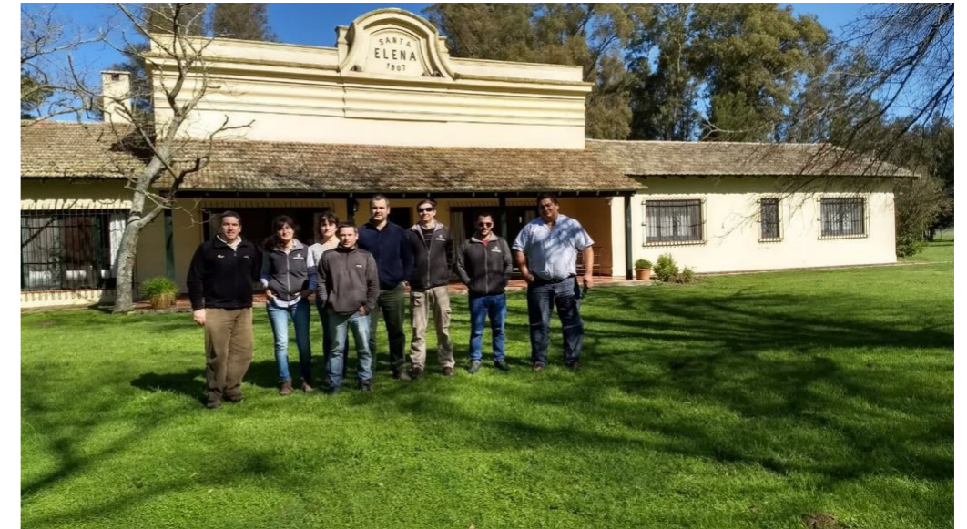
La fotografía muestra el momento en que se hizo un Taller sobre malezas. En la oportunidad se utilizó el campo

Esta nueva inversión le da a la Cooperativa - además del desarrollo agropecuario- otro punto de reunión propio para el desarrollo de sus actividades formativas.