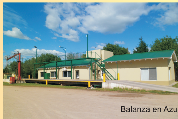
Balanza en Azul