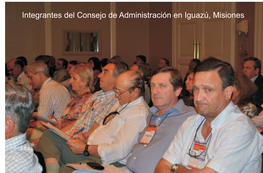
Integrantes del Consejo de Administración en Iguazú, Misiones

Participamos asociados de la Campo Abierta donde se comercializado oportunamente localidad. En la varias perspectivas de situación